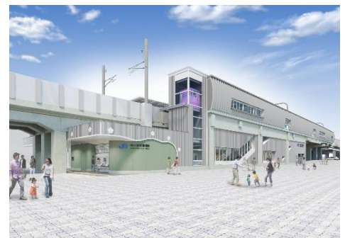
▲梅小路京都西駅のイメージ

開催日 10月28日(日) 時間 ①11:00 ②13:30 ③15:30 (各回約60分) 抽選場所 本館1階エスカレータ前 開催場所 新駅(梅小路京都西駅)建設現場 対象 小学生(要保護者同伴・同伴はお子様1名につき1人まで) 定員 各回10名 内容 来年春の開業に向けて建設が進む「梅小路京都西駅」の工事現場にお入りいただき、ホーム等の見学や、工事現場のおしごと体験、はたらく車への乗車体験ができます。 ※参加には、各回30分前から抽選場所で配布する整理券が必要です。希望者多数の場合、抽選を実施します。