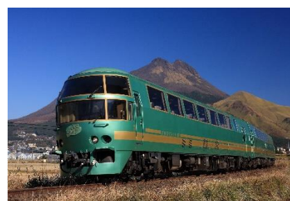
▲「ゆふいの森」

開催日 10月20日(土)・21日(日) (各日4回実施、各回約30分) 開場時間 各回開始時間の15分前 会場 本館3階 ホール 定員 100名(先着順) 協力 九州旅客鉄道株式会社