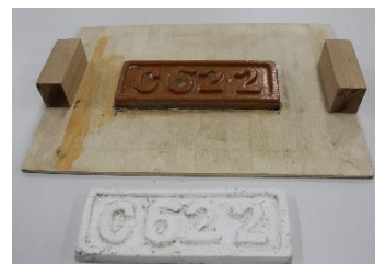
▲木型(上)と、完成見本(下)

開催期間 8月8日(水)～10日(金) 開催時間 10:00～16:00 (12:00～13:00 は休止) 所要時間 製作約30分・乾燥約30分 開催場所 本館1階車両工場 定員 各日先着48名 内容 SLのナンバープレートを模した小さな木型から、粘土を用いて型をうつし、そこに石膏を流し込むことによりミニナンバープレートを製作します。完成したミニナンバープレートは、ぜひ記念にお持ち帰りください。